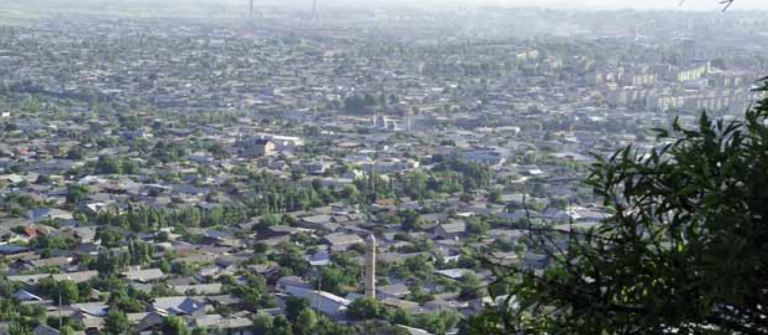
Eine kirgisische Stadt im Frühling