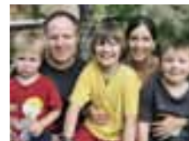
Barabara mit ihrer Familie