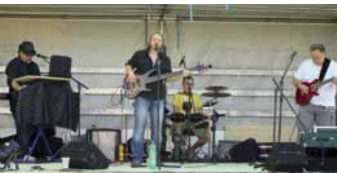
Die Musikband «fünf und zwei» (in Anlehnung an die fünf Brote und die zwei Fische) spielte hauptsächlich Songs von «Toto»

Vor ca. 30 Jahren hatten Menschen im Raum Aarburg, Olten und Zofingen einen Traum und ein Ziel: Sie wollten in Aarburg und Umgebung Gottes Gemeinde bauen. Die eher kleine Gemeinde existierte zwar schon etliche Jahre, traf sich aber immer wieder in anderen Lokalitäten. So kam der Wunsch auf, ein eigenes Gebäude zu besitzen, um noch besser und effektiver Gott dienen zu können.