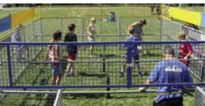
Die «Body soccer» – ein menschlicher Töggelikasten: Die Mitspieler sind an Stangen angebunden und spielen so Fussball ...