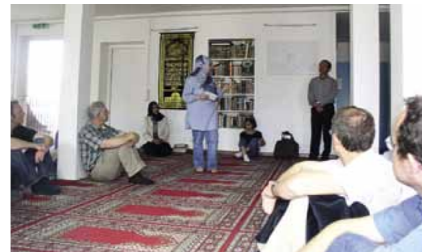
Links: Die islamische Religionslehrerin erklärt uns, wie mit einer Gebetskette die 99 Namen Allahs meditiert werden