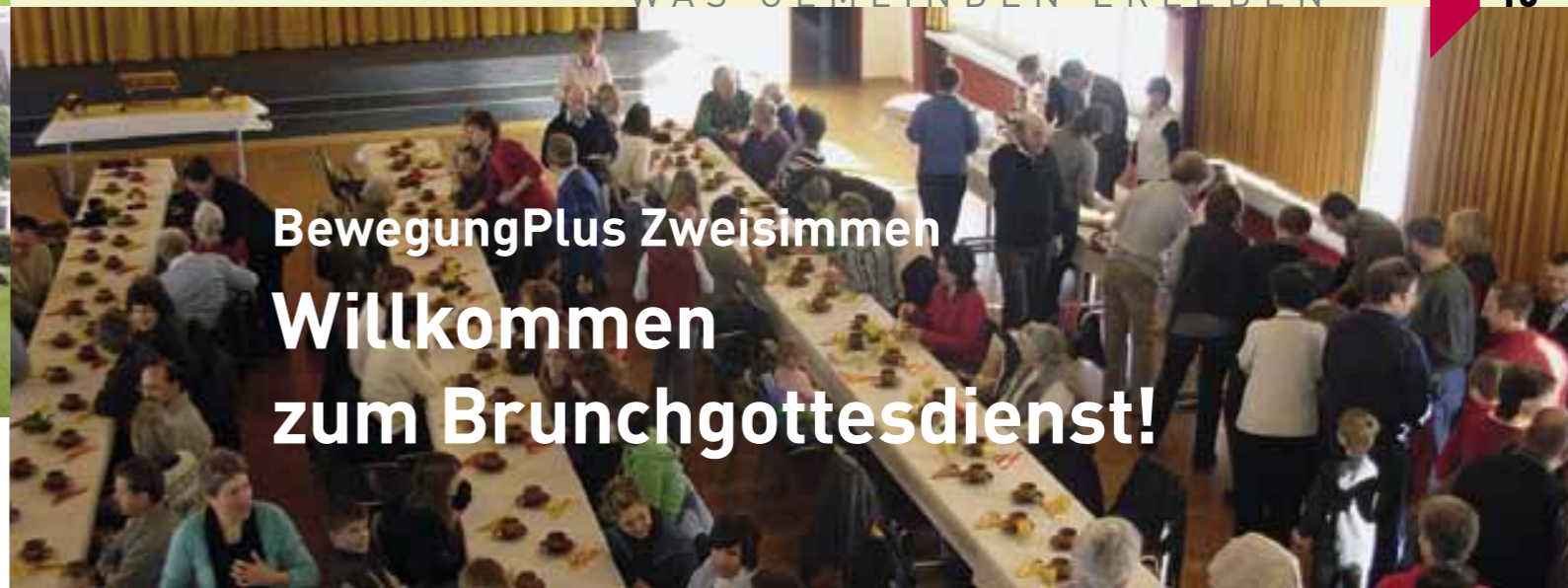
Der Brunch wird genossen!

25 Liter Orangensaft, 20 Liter Milch, 12 Liter Kaffee, 40 Eier, 7 kg Käse und 4 kg Fleisch stehen jeweils für die Besucher unserer Brunchgottesdienste bereit.