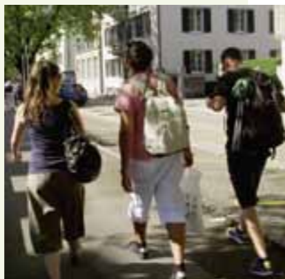
Auf Schatzsuche ...

Jeweils am Morgen hatten wir Andachts- und Worshipzeiten. Nachmittags ging es dann los mit Einsätzen in der Stadt. «Schatzsuche», «Hören vom Himmel», Getränke und Fünfliber verteilen und Menschen zu unseren Grillabenden einladen, standen auf der Liste. Es war herausfordernd und doch spannend, manchmal entmutigend und manchmal berührend, auf die Menschen zuzugehen und mit ihnen ins Gespräch zu kommen. Wir stellten fest, dass die Schweizer ein Volk sind, das lieber gibt als nimmt. Öfters hörten wir Fragen wie «Isch das vergiftet?» oder «Choschtet das würkli nüt?», wenn wir sie auf ein Getränk oder zu unseren «Grill'n'Chill»-Abenden einluden.