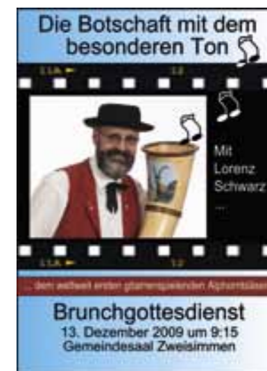
Flyer zu Brunchgottesdienst