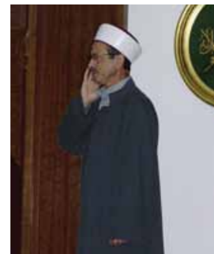
Rechts: Der Gebetsruf des türkischen Imams