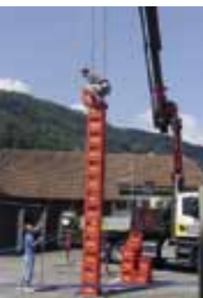
Ganz schön hoch – Harassen stapeln