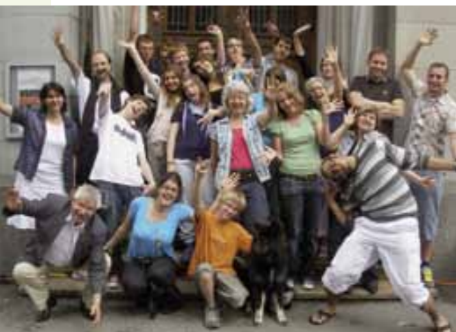
Einsatz in Zürich – das grosse Wir-sind-eine-grosse-Familie-Gefühl

Dänu geheimnisvoller Virus, tiefe Gespräche, intensive Kleingruppenzeiten, herausfordernde Aufgaben, wachsender Glaube, vor Lachen fast auf dem Boden liegen und das Wir-sind-eine-grosse-Familie-Gefühl – das sind einige Erinnerungen, die ich vom Einsatz in Zürich mitnehme.