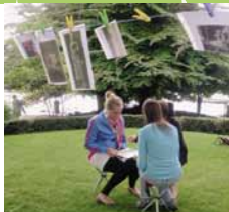
Hören vom Himmel